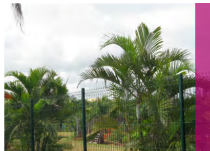
Panneau AQUILON® 45 Premium

Nous déclinons toute responsabilité si des pare-vues sont installés sur nos clôtures.