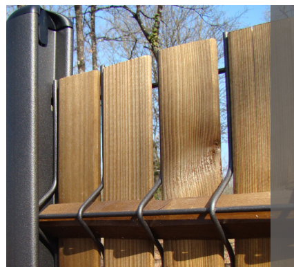
Panneaux ISIS® 44 avec poteaux ISIS® et le concept Aquiwood®

Le bois étant un matériau naturel, la couleur des lattes peut évoluer avec le temps. Ceci n'est pas un défaut mais une caractéristique propre au bois naturel.