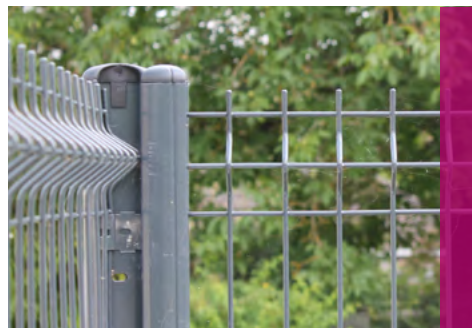
Clôture avec des panneaux AQUILON® 55 Premium

Nous déclinons toute responsabilité si des pare-vues sont installés sur nos clôtures.