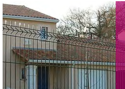
Panneau AQUILON® 45 Medium

Nous déclinons toute responsabilité si des pare-vues sont installés sur nos clôtures.