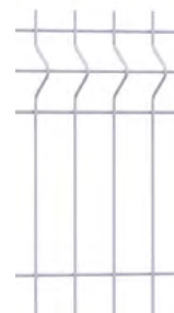
Panneau AQUILON® 45 Medium