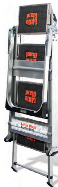
Position totalement fermée

Fermez le Safety Step en inclinant l'échelon supérieur dans le sens opposé.