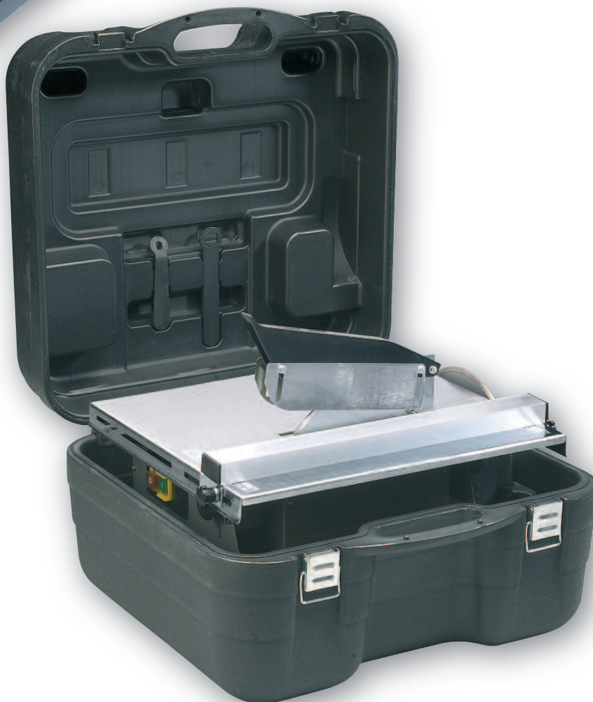
DIAMINIBOX 200 .....