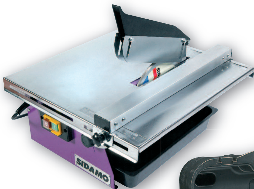
..... DIAMINIBOX 180