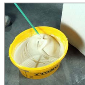
Malaxer le mélange mortier + eau