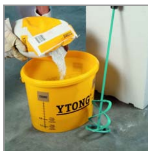
Préparation / dosage