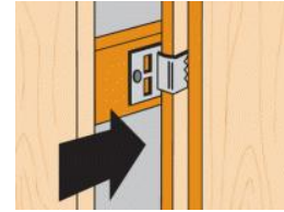
CLIP - mise en situation