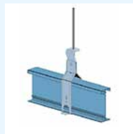
Fig. 2 Suspente I-TEC + Pivote I-TEC Charge admissible : 160 daN