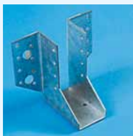
Fig. 4 Sabot