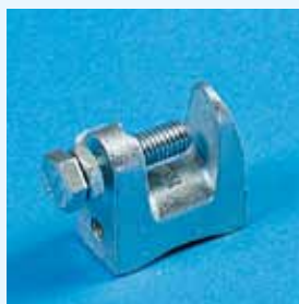
Fig. 1 ATK M6 - Charge admissible : 160 daN