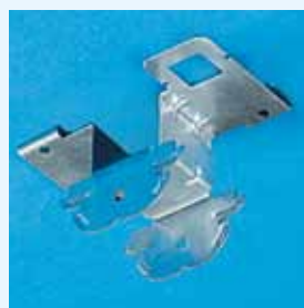
Fig. 3 Attache mixte