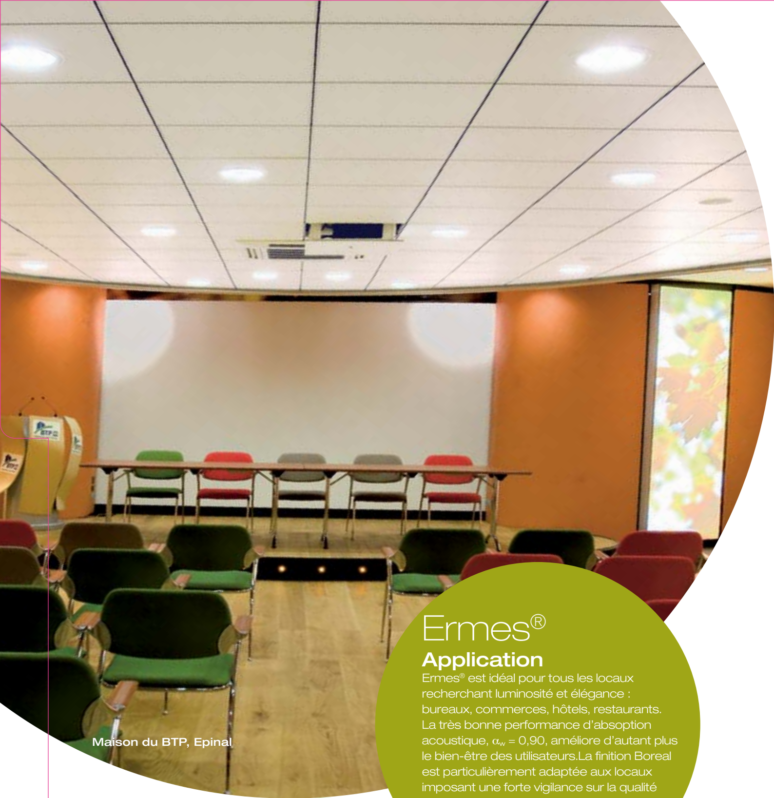
Maison du BTP, Epinal