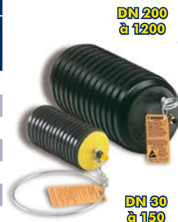
MULTI-TAILLE POUR PLUSIEURS DN