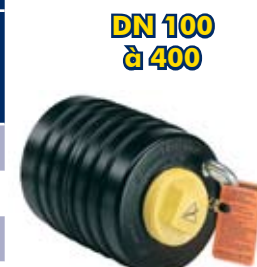
UNI-TAILLE POUR 1 DN + BY-PASS

Chaque référence UTB est fournie avec un bouchon à vis (Possibilité d'obturation simple) Pas de vis By-pass : Type BSP