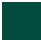
Vert 6005 B