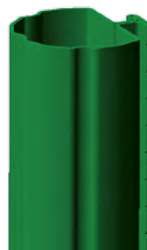
Profil du poteau Aquigraf® Ø50mm