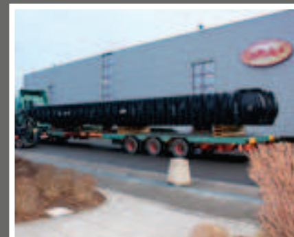
Cuve Platine XXL