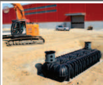
Cuve Platine XL