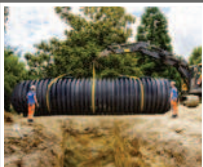
Cuve Carat XXL