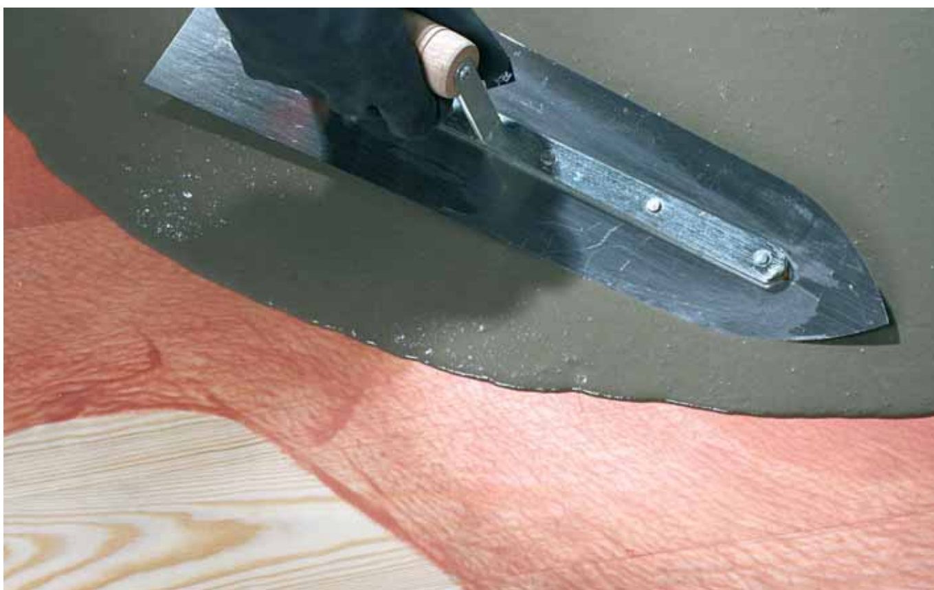
Associé au ragréage fibré RAGRENOV S30 ou RAGREFOR - pose sur bois