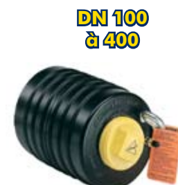
UNI-TAILLE POUR 1 DN + BY-PASS

Chaque référence UTB est fournie avec un bouchon à vis (Possibilité d'obturation simple) Pas de vis By-pass : Type BSP