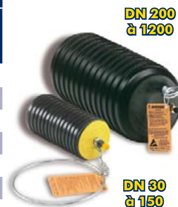
MULTI-TAILLE POUR PLUSIEURS DN