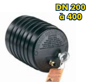
UNI-TAILLE POUR 1 DN