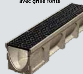
Caniveau Basicdrain 150 avec grille fonte

303051 100 20,4 15 20 17,5 34,0 20 121,40