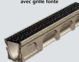
Caniveau Basicdrain 100 avec grille fonte

303234 100 15,5 10 17 14,5 24,4 28 87,00