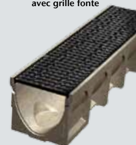
Caniveau Basicdrain 200 avec grille fonte

304479 100 25,4 20 22,5 20 46,0 12 168,60