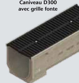
Caniveau D300 avec grille fonte