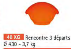
46 XG Rencontre 3 départs Ø 430 - 3,7 kg