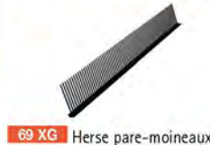
69 XG Herse pare-moineaux (cache-moineaux) - LAHERA