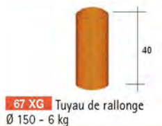
67 XG Tuyau de rallonge Ø 150 - 6 kg