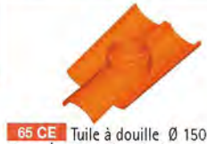
65 CE Tuile à douille Ø 150 Canal Evolution (3 tuiles) - 10,5 kg