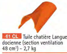
61 CL Tuile chatière Languedocienne (section ventilation 48 cm 2 ) - 2,7 kg