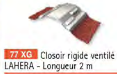
77 XG Closoir rigide ventilé LAHERA - Longueur 2 m