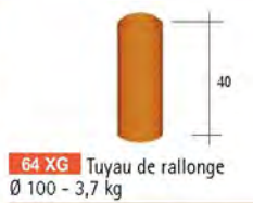
64 XG Tuyau de rallonge Ø 100 - 3,7 kg