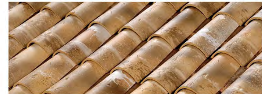
Vieux Pays castelviel