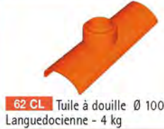
62 CL Tuile à douille Ø 100 Languedocienne - 4 kg