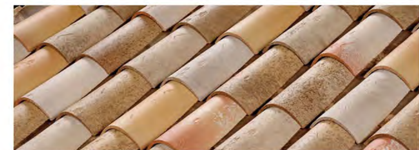
Vieux Pays panache