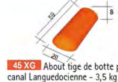
45 XG About tige de botte pour canal Languedocienne - 3,5 kg