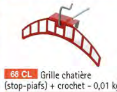
68 CL Grille chatière (stop-piafs) + crochet - 0,01 kg