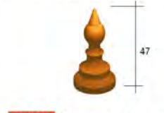
49 XG Poinçon en épi - 2,4 kg