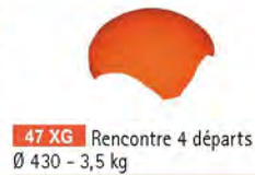
47 XG Rencontre 4 départs Ø 430 - 3,5 kg