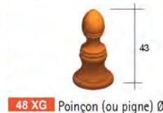
48 XG Poinçon (ou pigne) Ø 210 - 2 kg