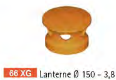
66 XG Lanterne Ø 150 - 3,8 kg