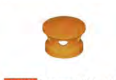
63 XG Lanterne Ø 100 - 1,6 kg