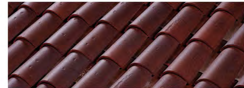
Vieux Pays brun violet